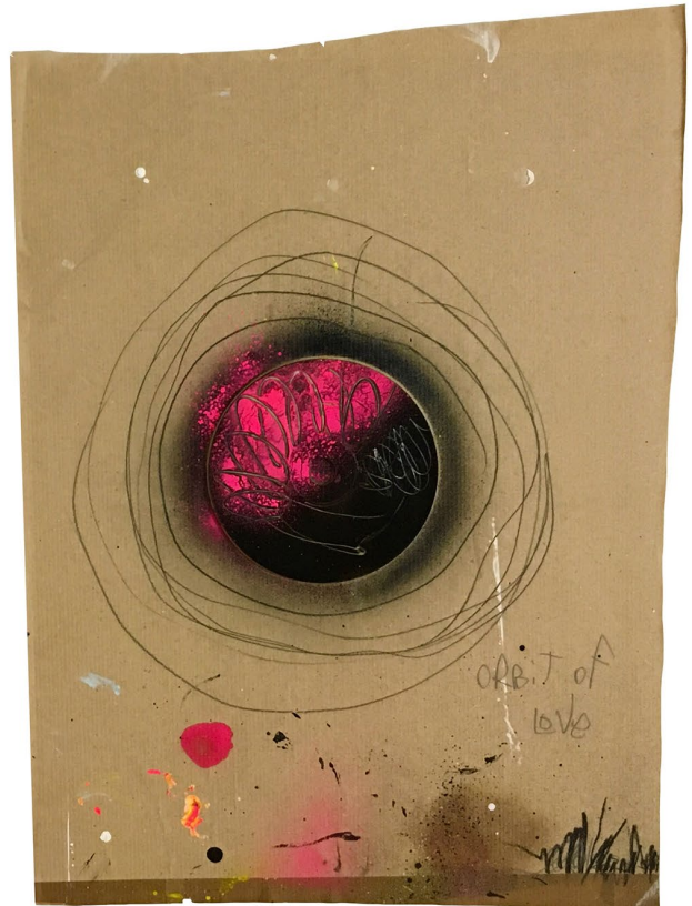
ORBIT OF LOVE I-2 Mixed Media on Wrapping Paper Foamboard | Assemblage Acryl, Graphite, Oil Pastel, Spray Paint, CD 37 x 46 cm | 35 x 48 cm 10.2020 & 05.2020